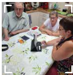
BÉNÉVOLES APPLICATION INTERREG