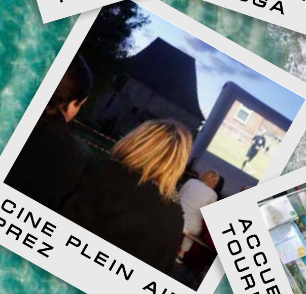
CINE PLEIN AIR PREZ