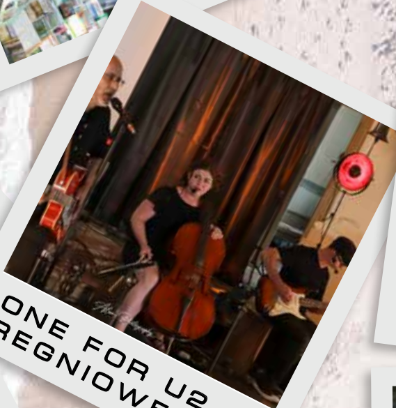
ONE FOR U2 REGNIOWEZ