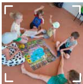
CENTRE AÉRÉ AUVILLERS-LES-FORGES