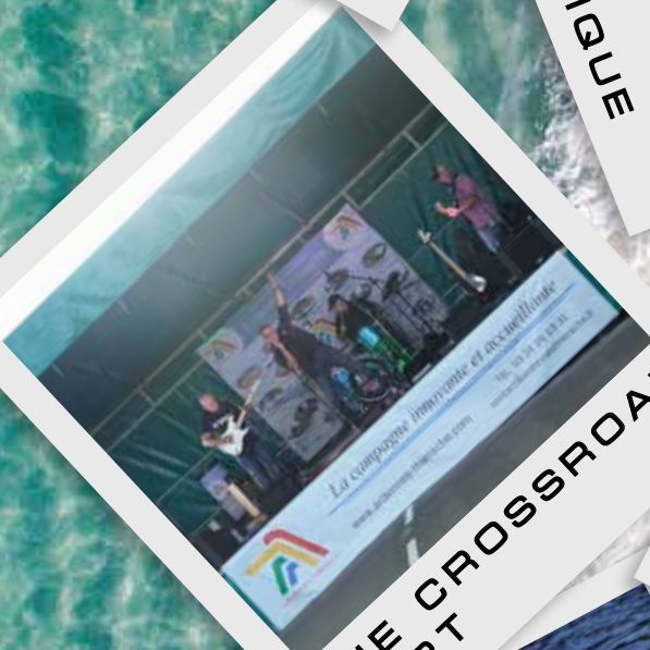
THE CROSSROAD LIART