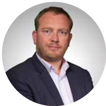
MIGUEL LEROY PRÉSIDENT D'ARDENNES THIÉRACHE MAIRE D'AUVILLERS-LES-FORGES

Après un été ensoleillé marqué par les animations à la base de loisirs de l'Étang de la Motte à Signy-le-Petit, les concerts ou encore les séances de cinéma en plein air... l'heure de la rentrée scolaire a sonné pour les 800 élèves, les 40 enseignants et les 60 agents intercommunaux des écoles élémentaires du territoire d'Ardennes Thiérache.