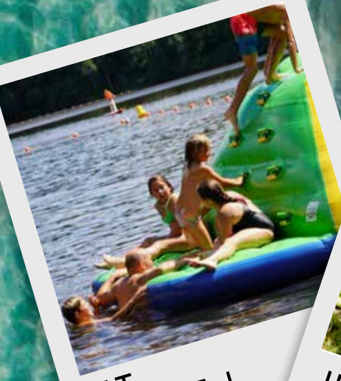
ET PLOUF !